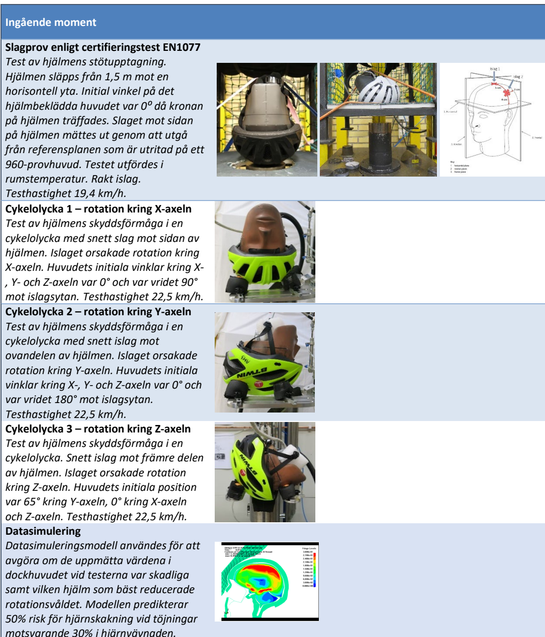
Tabell 2. Ingående testmoment

Två hjälmar testades för varje testmoment för att minska inverkan av mätosäkerhet. Vidare har datasimulering genomförts för att bättre värdera risken för skada vid de sneda islagen baserat på mätvärden i de fysiska testerna. I datasimuleringen används en modell av människohjärnan som är framtagen av forskare vid Kungliga Tekniska Högskolan (KTH) (Fahlstedt, M. m fl 2022). Eftersom datasimuleringsmodellen är uppbyggd utifrån hjärnans toleransnivåer, användes denna för att