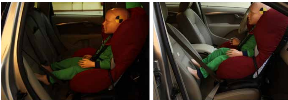
Bild 3. Bilbarnstol monterad i baksäte respektive framsäte i en Volvo V70.

I Folksams test ingår totalt 32 bilbarnstolar som riktar sig till barn mellan nio månader till cirka fyra år, Tabell 1. Vid val av bilbarnstolar tittade vi på utbudet i barnproduktbutiker och webbbutiker. Vi valde dessutom att inkludera stolar som kommit bra ut i europeiska bilbarnstolstester. Folksam har lång erfarenhet inom barnsäkerhetsområdet och vi har till och med under en period utvecklat egna bilbarnstolar. Genom att studera trafikolyckor liksom krocktester vet vi vad som har betydelse för att skydda ett barn så bra som möjligt i bil. Nedan framgår vilka parametrar som vi tycker är allra viktigast för att möjliggöra att ett barn kan åka bakåtvänt så länge som möjligt och att barnet är så bra skyddat som möjligt vid en eventuell krock. Vissa mätmoment har utförts då bilbarnstolen har monterats både i fram- och baksätet i en Volvo V70, Bild 3. En krockdocka (Hybrid III) som motsvarar en treåring har används för att få en så verklighetsnära mätning som möjligt.