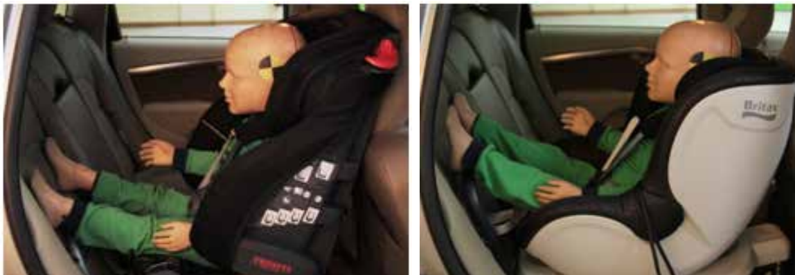
Bild 4. Till vänster bilbarnstol med hög stolsrygg och till höger en stol med betydligt lägre stolsrygg.

För att möjliggöra att barnet kan åka så länge som möjligt i stolen är det viktigt att stolens ryggstöd är högt. Bild 4. I bilden nedan till höger är dockan, som motsvarar en treåring, nästan för stor för stolen. En bakåtvänd bilbarnstol är urvuxen när barnets övre del av öronen är i höjd med stolens översta kant. Ju högre stolsrygg desto bättre.