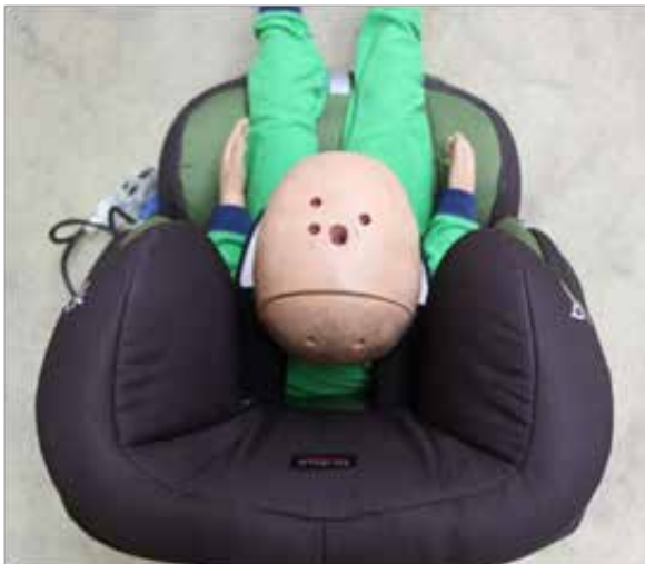
Bild 7. Britax Römer Multi Tech II är ett exempel på en stol med bra sidoskydd.

Istället för vikt märks i-Size-stolarna med max längd. Det finns dock en viss risk att UN R129 kan innebära försämringar för de svenska barnen då de stora bakåtvända stolarna får problem att inkluderas i denna standard. Detta är dock något som den svenska barngruppen SIS/TK 242 Barnsäkerhet i bil arbetar med 14 . I Folksams test ingår fem stolar som är godkända enligt UN R129 (i-Size). Dessa stolar är godkända till 105 cm har generellt kortare ryggstöd, vilket innebär att barnet snabbare växer ur stolen och därmed vänds framåt. Det är därför glädjande att BeSafe iZi Kid i-Size, BeSafe iZi Modular i-Size och Maxi-Cosi Pearl XP har ett ryggstöd som är högre än 60 cm. Det enda negativa med dessa är att de är godkänd till 105 cm (cirka 18 kg), vilket ungefär motsvarar en medelstor fyraåring. För att möjliggöra bakåtvänt åkande högre upp i åldrarna bör stolen var godkänd till 25 kg.