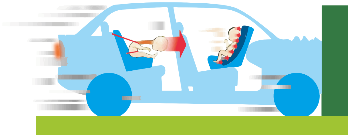
Bild 2. Belastning på nacke och huvud i en bakåtvänd respektive framåtvänd bilbarnstol