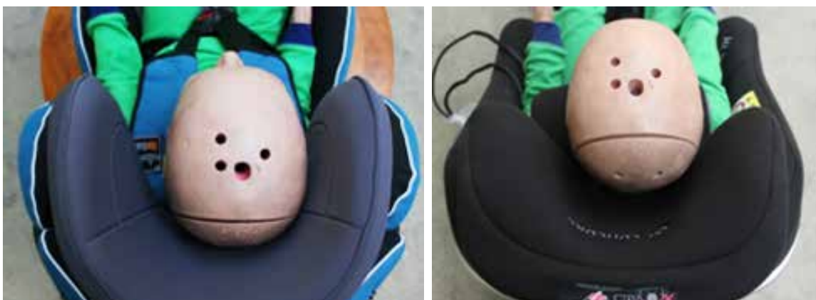
Bild 6. Till vänster stol med djupa sidoskydd runt huvudet och till höger en stol med relativt grunt sidoskydd runt huvudet.

För att skydda huvudet så bra som möjligt är det dock viktigt att stolens sidoskydd är så djupt som möjligt och att stolen är relativt tätt kring barnets huvud. Bild 6 nedan visar exempel på en bra och en mindre bra stol. En bakåtvänd bilbarnstol med djupa sidokanter och med så liten bredd som möjligt kan minska risken att huvudet roterar ut ur barnstolen. Ju djupare desto högre poäng i Folksams klassning.